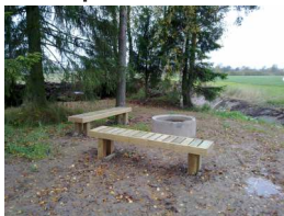
P-alue, makkaranpaisto ja veneenlaskupaikka